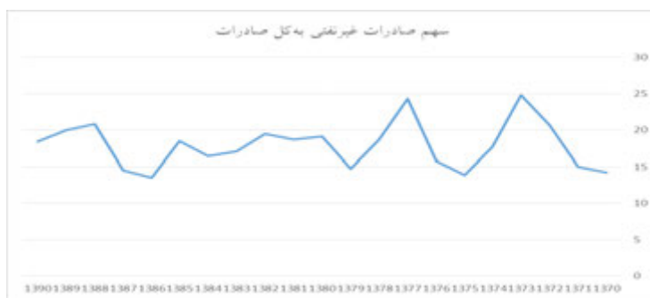
شکل ۵- سهم صادرات غیر نفتی به کل صادرات براساس آمار گمرک جمهوری اسلامی

علاوه بر تنوع‌بخشی به محصولات صادراتی، تنوع در مقاصد صادراتی و تنوع مشتری‌ها برای کاهش آسیب‌پذیری امری لازم و ضروری است. یکی از عوامل آسیب‌زا در تحریم‌ها، نداشتن تنوع و گستره مشتری‌ها و خریداران برای کالاهای ایرانی بوده است. بعد از انقلاب، سهم پنج شریک اول صادراتی ایران از صادرات ایران چیزی حدود ۵۰ درصد بوده است. هم‌اکنون ایران بیشترین صادرات را به عراق و در مقام دوم به چین دارد (وزارت اقتصاد و امور دارایی، ۱۳۹۳).