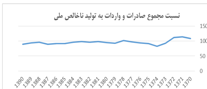
شکل ۴- نسبت مجموع صادرات و واردات به تولید ناخالص ملی براساس آمار گمرک جمهوری اسلامی

درجه بالای باز بودن اقتصاد، کشور را به سوی شرایطی سوق خواهد داد که قابل کنترل در برابر تکانه‌های خارجی نخواهد بود. درجه باز بودن اقتصاد تا حد بسیار زیادی از ویژگی‌های ذاتی اقتصاد است که از توانایی اقتصاد برای تولید طیف وسیعی از کالا و خدمات به منظور تأمین تقاضای کل ناشی می‌شود. اگر میزان تولیدات یک کشور محدود باشد و طیف محدودی از کالاها را تولید کند، آن‌گاه برای تأمین سایر نیازهای خود باید به واردات کالا و خدمات یا واردات سرمایه روی بیاورد. همان‌گونه که در شکل ۴ ملاحظه می‌شود، وضعیت این شاخص برای کشور در وضعیت مرزی قرار دارد؛ به گونه‌ای که باید سیاست‌گذاری تجاری دقیقی در این حوزه صورت پذیرد.