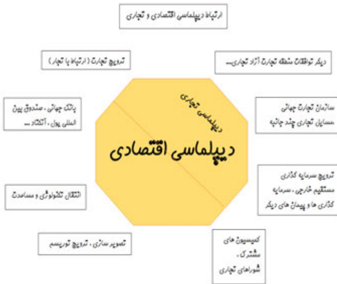
شکل ۷- تعامل کارکردها و بازیگران دیپلماسی اقتصادی و تجاری