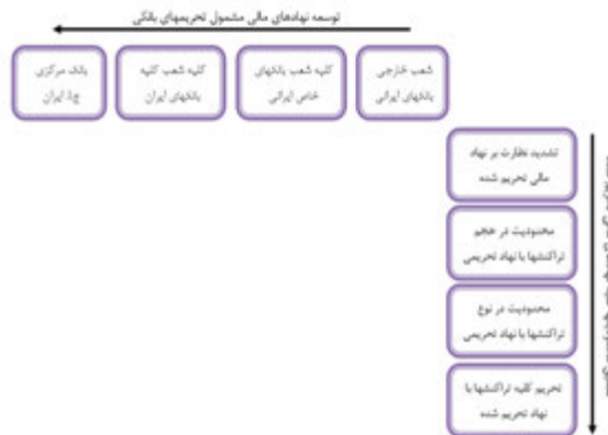
شکل ۲- روند تکاملی تحریم‌های مالی و پولی علیه ایران

روند تکاملی تحریم‌های مالی و بانکی در دو بعد ذیل پیگیری شده است: