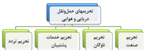
شکل ۳- نقشه کلان تحریم‌های حمل و نقل علیه ایران

روش حمل و نقل دریایی، با توجه به برخورداری ایران از بنادر متعدد در سواحل دریای خزر، دریای عمان و خلیج فارس، اهمیتی راهبردی برای کشور دارد. از یک سو، بیش از ۹۰ درصد تجارت ایران از طریق دریا انجام می‌شود. از سوی دیگر، ناوگان کشتی‌های تجاری و نفت‌کش ایران بزرگ‌ترین ناوگان در منطقه و چهارمین ناوگان بزرگ در دنیاست. برخورداری از این ناوگان مجهز امکان کسب درآمد برای ایران از طریق اجاره دادن کشتی و نفت‌کش را مهیا کرده است. همچنین بیش از ۹۰ درصد صادرات نفت و فراورده‌های نفتی ایران از طریق دریا صورت می‌گیرد. لذا کشورهای متخاصم که به خوبی این اهمیت را درک کرده‌اند، تلاش می‌کنند محدودیت‌هایی را در فرایندهای مختلف حمل و نقل دریایی برای ایران ایجاد کنند.