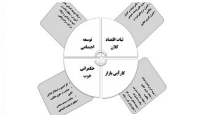
شکل ۲- شرایط لازم برای تاب‌آوری اقتصادی (بریگوگیو، ۲۰۰۸: ۷)

متغیرهای اصلی تاب‌آوری اقتصادی عبارت‌اند از: اول، متغیرهای اقتصادی که توسط پایداری اقتصادی کلان و کارایی اقتصاد بررسی می‌شوند؛ دوم، متغیرهای اجتماعی - سیاسی که از سوی حکمرانی سیاسی خوب و توسعه اجتماعی مورد بررسی قرار می‌گیرند در شکل ۲ شرایط لازم برای تاب‌آوری اقتصاد و متغیرهای اصلی آن آمده است.