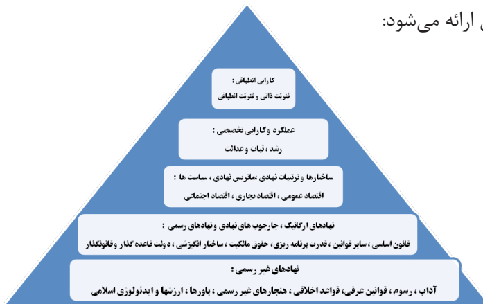
شکل ۳- چارچوب نظری برای طراحی الگوی کارایی اقتصاد مقاومتی جمهوری اسلامی ایران (منبع: تحقیق حاضر)

لذا حضرت امام خامنه‌ای نیز بر پیشرفت و عدالت، در مسیر رشد اقتصادی تأکید دارند و از طرفی، ثبات، رشد و عدالت از اصول اساسی اقتصاد در اصل سیزدهم قانون اساسی است. بنابراین، کارایی تخصیصی باید به سمت رشد، ثبات و عدالت، و کارایی انطباقی نیز به سمت تاب‌آوری اقتصاد حرکت کند. با توجه به موارد فوق، چارچوب نظری تحقیق ارائه می‌شود: